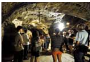
Visite dans le souterrain de la Règle