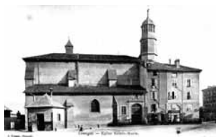
Église Sainte-Marie, carte postale ancienne

avec la complicité du bistrot Le Lutétia