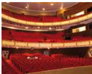
Opéra-Théâtre de Limoges

Succédant au cirque-théâtre, le Grand Théâtre est inauguré en 1963. Venez découvrir l'envers du décor, entrez dans la fabrique de l'illusion et l'univers du rêve et appréciez une machinerie audacieuse. TG