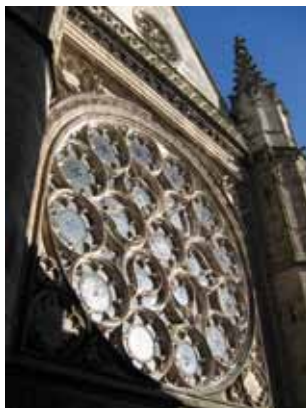
Rose sud de la cathédrale Saint-Étienne