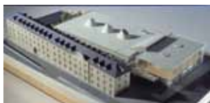
Maquette de la Bfm (agence Pierre Riboulet)

Lumineuse, chaleureuse, accueillante... la Bibliothèque francophone multimédia s'est imposée dans le paysage urbain. Vous croyez peut-être la connaître par cœur ? Venez donc l'explorer de fond en comble. Qui sait si, entre ses lignes épurées, elle ne vous livrera pas quelques secrets sur Limoges ?