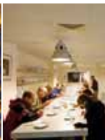
Atelier à la maison de l'émail