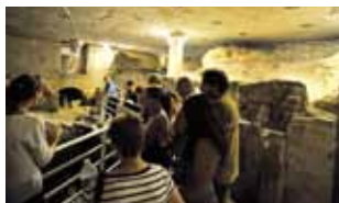
Visite dans la crypte Saint-Martial