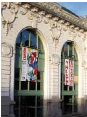
Façade du Théâtre de l'Union

Entrez dans les coulisses du Théâtre de l'Union puis du Fonds Régional d'Art Contemporain. Vous revivez de façon originale l'histoire de ce site depuis la création des magasins COOP à la fin du XIX e siècle jusqu'à aujourd'hui. TG