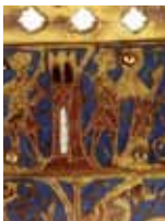
Chasse de Sainte-Valérie (BAL)

TS adultes : 13,50 €, demandeurs d'emploi : 11,50 €, enfants, étudiants : 10,50 €