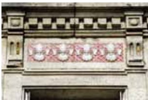
Décor en porcelaine, square des Émailleurs

Entre square et hôtels particuliers, vous parcourez des quartiers lotis à la fin du XIX e siècle et à la Belle Époque. Vous scrutez les façades et appréciez la diversité des matières, motifs et couleurs des décors. À vous de jouer les experts entre grès, faïence et porcelaine... TG