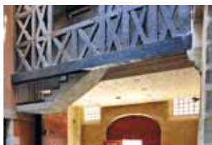
Cour intérieure, hôtel de Lostende

Avec la complicité de la Chambre de Commerce et d'Industrie de Limoges et de la Haute-Vienne, vous voici sur un toit-terrasse qui vous offre un point de vue inédit sur la ville, depuis la cathédrale Saint-Étienne toute proche jusqu'à la lointaine coupole d'Ester Technopole.