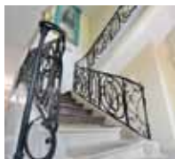
Hôtel Nieaud, rue des Vénitiens

- 22/12 et 06/03 Fenêtres sur cour : au cœur de la ville haute, édifices des XVII e et XVIII e siècles.