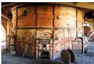
Four à porcelaine des Casseaux