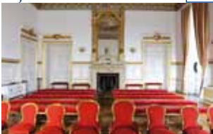
Salle des mariages, Hôtel de ville

Edifié grâce au don d'un mécène et inauguré en 1883, l'Hôtel de ville présente une somptueuse façade en calcaire associant de façon harmonieuse plusieurs styles architecturaux. Venez découvrir l'histoire de cet édifice, ses salles prestigieuses et sa place éminente dans la vie de la cité, d'hier à aujourd'hui. TG