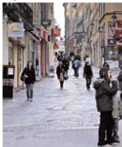
Rue du clocher