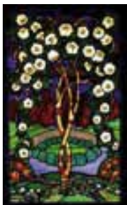
L'arbre en fleurs de Francis Chigot (BAL)