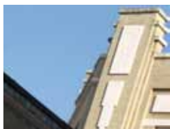
Immeuble des PTT

À l'aube du XX e siècle, voilà qu'on entreprend un grand réaménagement du centre-ville. C'est le temps des lignes pures, du béton et des élégants décors géométriques. Du Pavillon du Verdurier à la Maison du Peuple, savourez des architectures labellisées Patrimoine du XX e siècle. TG