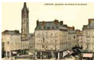
Place d'Aine, carte postale ancienne

avec la complicité du restaurant Le Versailles