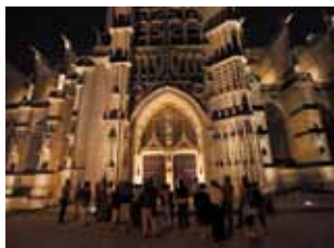
Portail Saint-Jean, cathédrale Saint-Étienne

Dès la nuit tombée, en compagnie d'un guide, vous découvrez Limoges en habit de lumière. Monuments, maisons, portails, campaniles, clochetons illuminés vous apparaissent transfigurés. TG