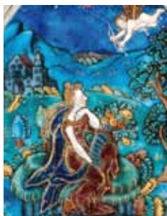
Jean Guibert, Amour décochant une flèche , musée des Beaux-Arts de Limoges